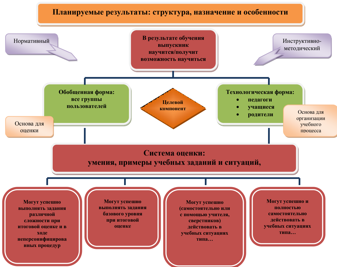
Рис. 1. Особенности структуры планируемых результатов. Функция и назначение.

Система оценки достижения планируемых результатов освоения основной образовательной программы основного общего образования (далее – система оценки) представляет собой один из инструментов реализации требований Стандарта к результатам освоения основной образовательной программы основного общего образования, направленный на обеспечение качества образования, что предполагает вовлечённость в оценочную деятельность как педагогов, так и обучающихся (рис. 1).